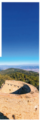
Castell de Sant Miquel