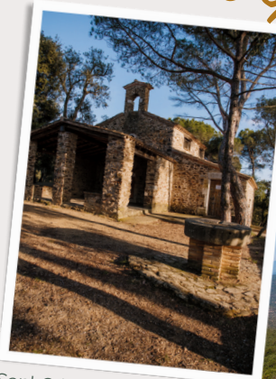
Sant Cristòfol del Bosc