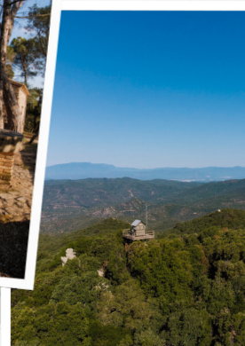
Puig de Cadiretes