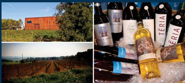
CELLER PAGO DIANA - SANT JORDI DESVALLS